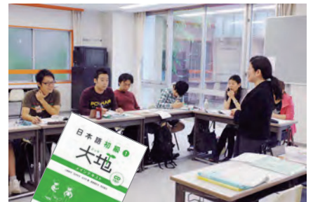
수업풍경 및 사용교재

경험 풍부한 강사진이 당신의 꿈이 확실히 실현되도록 엄격하고도 상냥하게 지도합니다. 공부 이외에도 아르바이트 지원의 모의면접이나 이력서 쓰는 법의 지도 등도 실시합니다. 진로에 대해서는 중앙공학교 그룹 학교로의 진학 지도는 물론, 전문학교, 대학, 대학원 이외에도 대학 편입 등도 강력하게 지원하고 있습니다. 전문대학 졸업자는 일본의 대학 3학년 편입에 도전해 보시기 바랍니다.